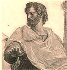
Aristóteles de Estagira.